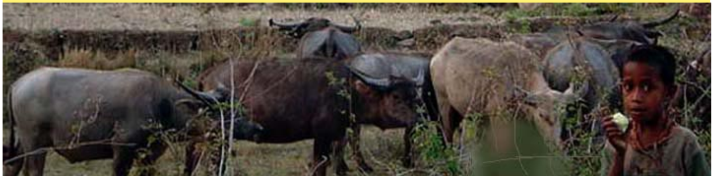
Karau Timor: nilainya terletak pada tanduknya.

Kerbau atau karau Timor sangat penting perannya dalam upacara-upacara adat. Nilainya terletak pada panjang-pendek tanduknya bukan besar badannya. Gengsi keluarga ditentukan oleh panjangnya tanduk kerbau yang diberikan dalam upacara-upacara adat.