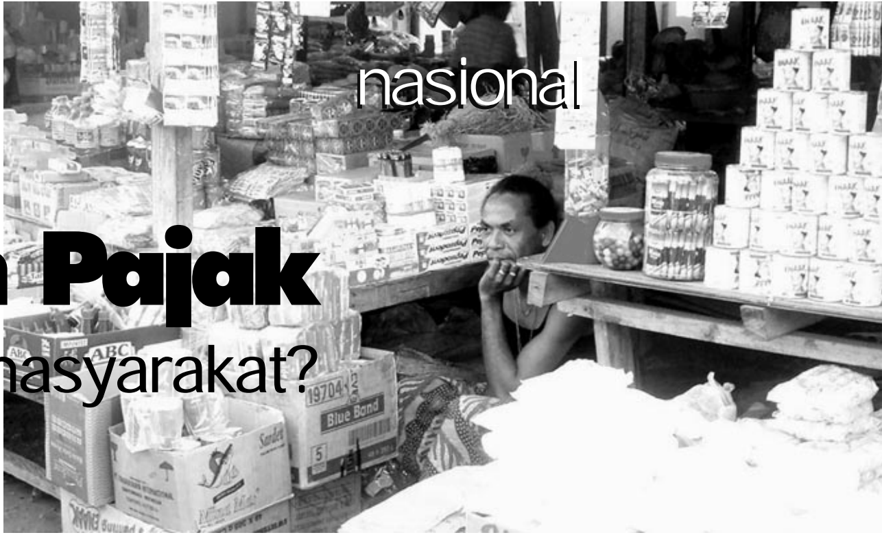
Pedagang bahan kebutuhan sehari-hari di Mercado Comoro, Dili.

Kenaikan pajak disebut-sebut menyebabkan naiknya harga barang-barang kebutuhan pokok. Seberapaakah kenaikan yang benar-benar terjadi?