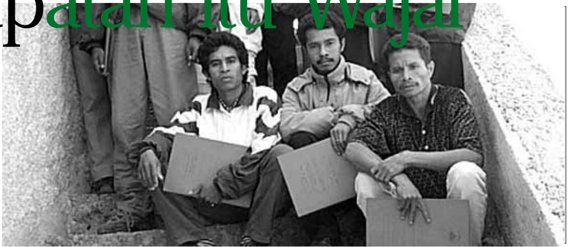
Para guruSLTP sehabis mengikuti trening HAM di Maubisse.

Negara membutuhkan dana untuk membiayai kehidupannya. Untuk itu salah satu sumber dana atau anggaran pemerintah salah satunya dari pajak. Tetapi kebanyakan masyarakatan yang mempunyai pendapatan menganggap pengenaan pajak ialah hal yang wajar karena setiap negara membutuhkan dana untuk pembangunan.