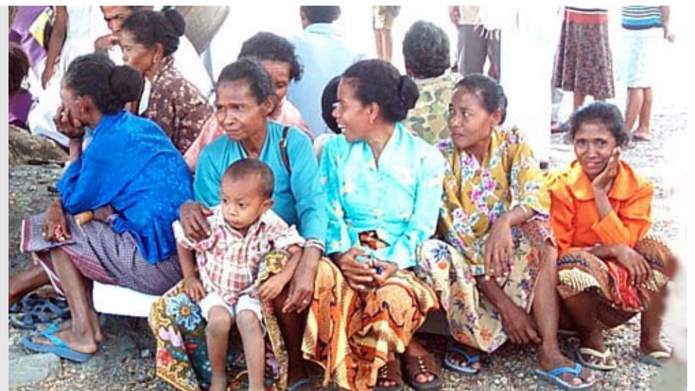
Suasana rekonsiliasi komunitas, Maumeta, Liquiça.

Kemudian dilanjutkan dengan dengar pendapat dari para pelaku kekerasan, yaitu pengakuan kesalahan kepada masyarakat, terutama kepada pelaku. Pada prinsipnya mereka mengatakan bahwa mereka melakukan kekerasan bukan atas kemauan sendiri, tetapi karena dipaksa oleh tentara Indonesia. Walaupun demikian, mereka mengaku bersalah dan meminta maaf atas semua tindakan mereka kepada para korban. Mereka juga berjanji bahwa di masa yang akan datang tidak akan melakukan kekerasan un-