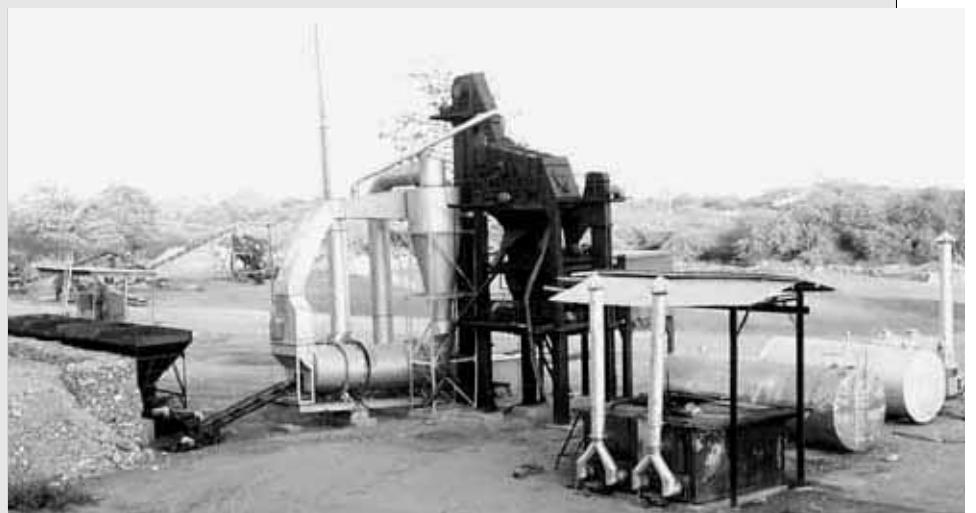
Penggilingan batu di Ulmera, Liquiça.

Karena belum ada peraturan perundang-undangan, pemerintah belum melakukan kontrol dan pembatasan terhadap investor yang masuk. "Setelah ada undang-undang investasi dan peraturan kegiatan komersial, kita akan lihat siapa yang bisa mengeksport dan mengimpor barang. Kita harus mengontrol operasi mereka di lapangan. Kalau membuka usaha mereka harus mendapatkan rekomendasi dari instansi terkait. Tidak seperti masa transisi dulu, penguasah datang hanya mendaftarkan diri, tetapi tidak ada