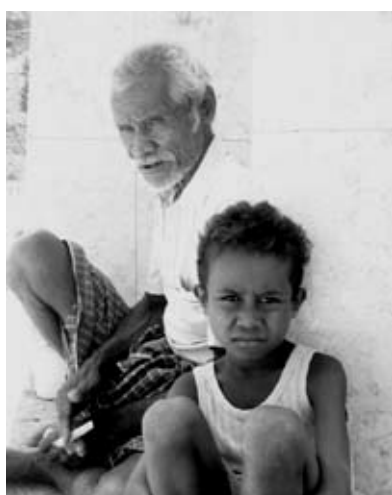
Kakek dan cucu, Manatuto.

Tetapi jangan keliru. Di negara-negara kaya rakyat tidak membayar pajak dengan rela karena nasionalisme tinggi. Tidak. Sebagai warganegara Amerika, saya membayar pajak karena merasa takut. Takut kepada sanksi hukum. Dan mau tak mau, rakyat Timor akan belajar merasa takut kepada negara sendiri juga. Para penguasa seharusnya menjelaskan kenaikan pajak dan media massa memuat informasi secara jelas. ●