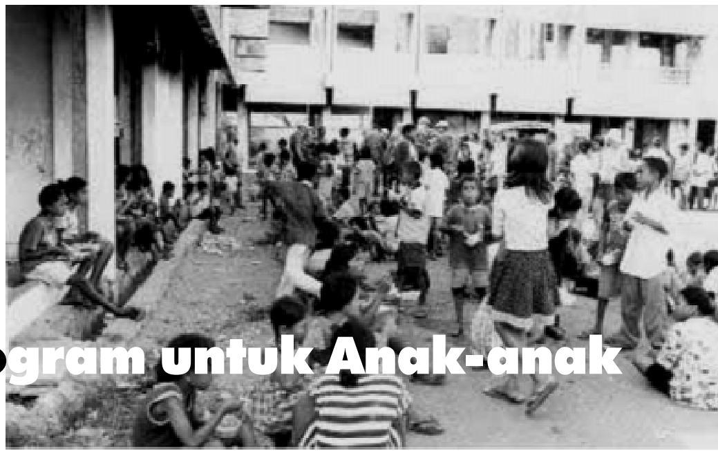
Kesehatan anak-anak menentukan kemajuan bangsa.

Program ini dimulai 1983 ketika Zilda Arns mulai melancarkan "upaya terencana" di Florestópolis, kota miskin di negara bagian Paraná. Saat itu, 72 persen dari 14.700 penduduk hidup dari pe-