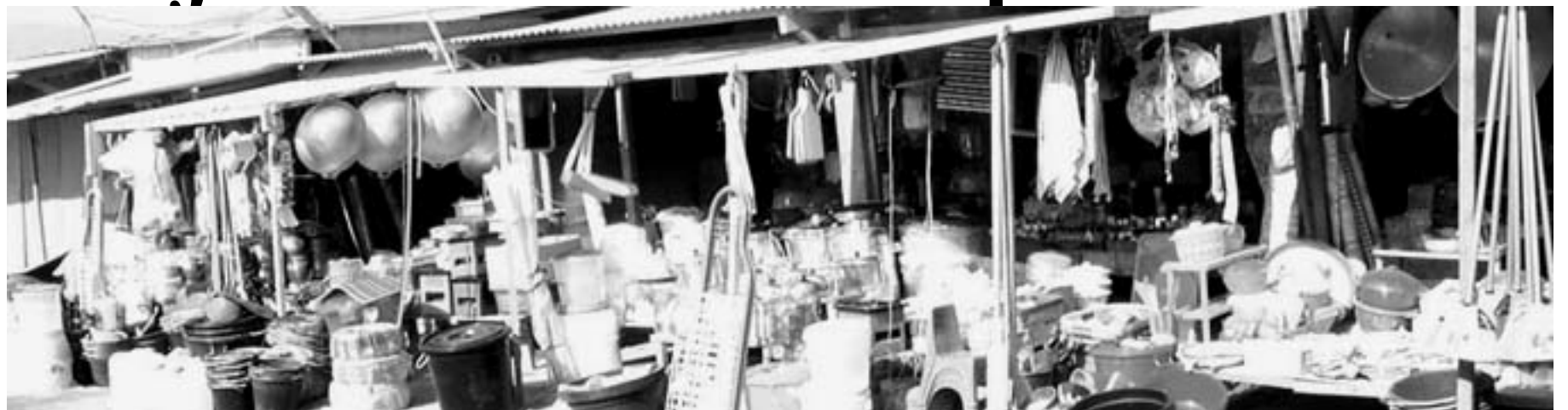
Barang impor peralatan rumah tangga.

Anggapan bahwa pajak di Timor Lorosae besarnya 20 persen benar-benar tidak ada dasarnya. Ringkasan perubahan sistem perpajakan yang diperoleh Cidadaun dari Parlemen Nasional memperlihatkan hal ini. Dalam lembaran berjudul yang berjudul "Sumário das Mudanças, Lei de Modificação do Sistema Tributário 2002" yang agaknya dikeluarkan oleh Serviço de Receitas Timor Leste (Dinas Pendapatan Timor Leste) ini disebutkan bahwa mulai 1 Juli 2002 berlaku perubahan pajak. Dalam perubahan ini pajak dinaikkan antara 1-2%.