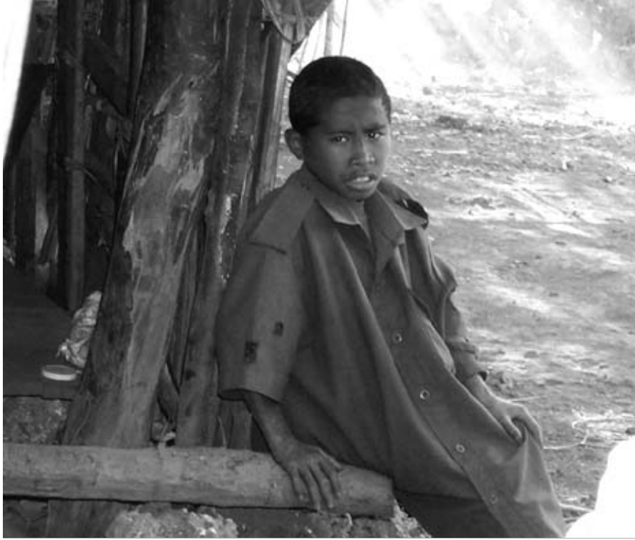
Kehidupan di Matebian.